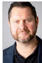
Projektleitung Leiten und Beraten